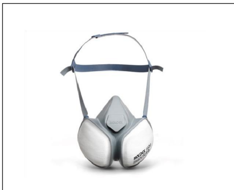
1. Mask FFABEK1 P3 R D

Det anbefales at have en multifiltermaske til rådighed til uheldssituationer, hvor der spildes eller tabes et kemikalie, der danner farlige dampe. Nedenstående maske (1) filtrerer organiske dampe med kogepunkt over 65 °C, uorganiske og sure gasser samt ammoniak. Derudover er der et partikelfilter imod bakterier og vira. Hvis der sker uheld med Formaldehyd, skal der anvendes en nedenstående maske (2). Maskerne kan ikke bruges til kviksølvspild.