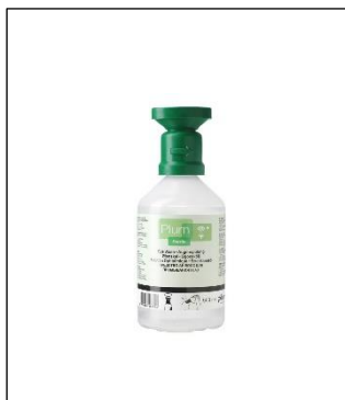
Øjenskylleflaske i lommeformat