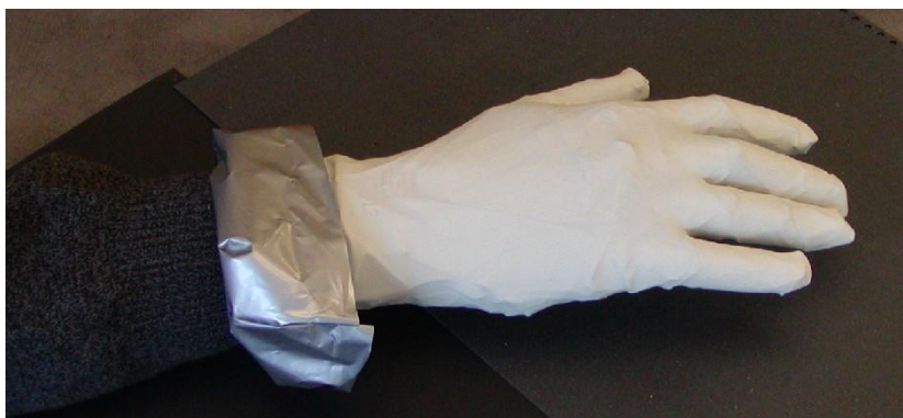
Barrierehandske med engangshandske ovenpå