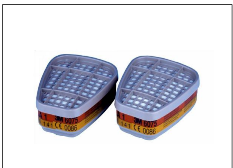
2. Fra 3M A/S Halvmaske med udskiftelige filtre