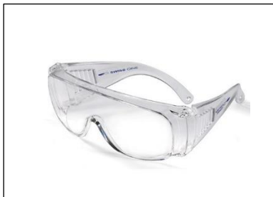
Beskyttelsesbrille i fast plast

Når der er risiko for, at et kemikalie kan ramme øjet, skal der anvendes øjenbeskyttelse. Dette kan f.eks. være ved skift af dunk med maskinopvaskemiddel.