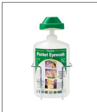
Øjenskylleflaske 500 ml