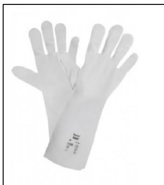
Barrierehandske" tilgængelig i RM Indkøb

Når det er nødvendigt at have stor kontakt eller længerevarende kontakt med et kemikalie, eksempelvis ved opsamling af spild, vil en barrierehandske ofte blive anbefalet. Handsken er testet uigennemtrængelig for en lang række kemikalier i mindst 4 timer. Man kan med fordel anvende en bomuldshandske inderst og en engangshandske yderst for maksimal komfort.