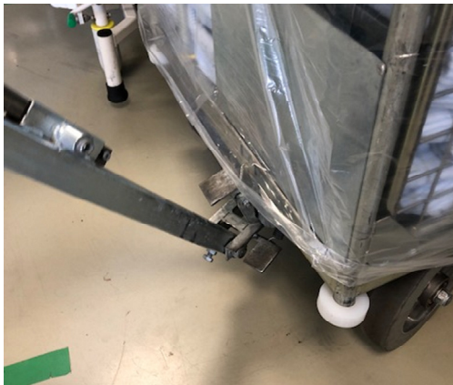
Før roligt trækstangen ind under bremsen

Træd på den lille pedal og forlæng trækstangen, når du skal køre med vognen.