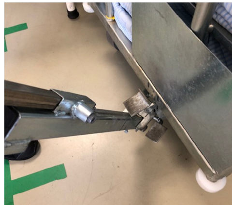
og vip den op med trækstangen

Du kan låse bremsen op ved med begge hænder og i et roligt tempo at føre trækstangen ind under bremsepedalen og vippe den op med trækstangen.